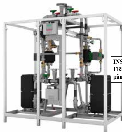
INSTALAȚIE DUBLĂ FRIWASTA-Plus 250 până la 800 l/min