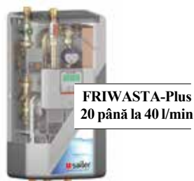
FRIWASTA-Plus 20 până la 40 l/min

Stațiile de apă proaspătă își găsesc utilizarea în construcția de locuințe private, în alimentația publică, pensiuni, hoteluri, spații de cazare, clădirile municipale și publice, spitale, cămine, clădiri militare, clădiri de protecție civilă, pompieri, birouri, unități de producție, spălătorii, cantine, etc.