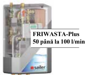
FRIWASTA-Plus 50 până la 100 l/min