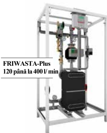
FRIWASTA-Plus 120 până la 400 l/min